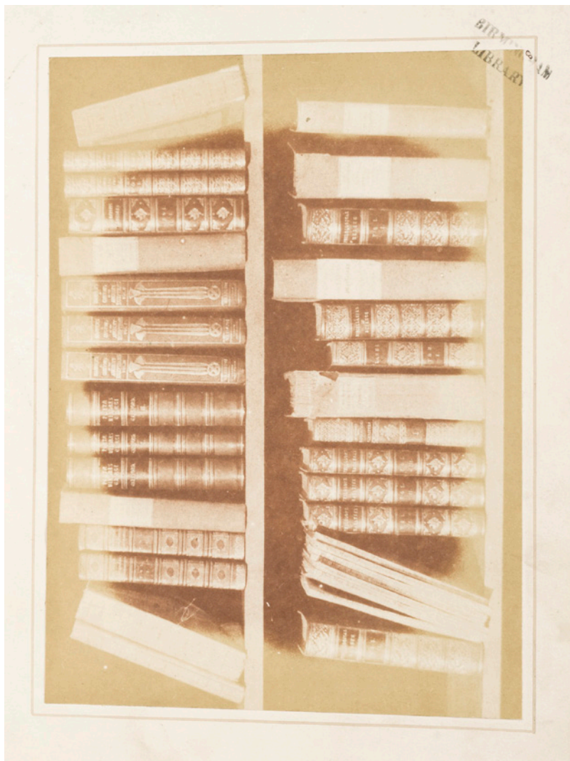
Fox Talbot, The Pencil of Nature, 1844-46, tilhører Preus museums samling